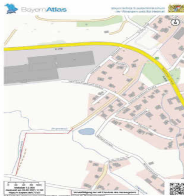
Möglicher Verbindungsweg = rote Linie