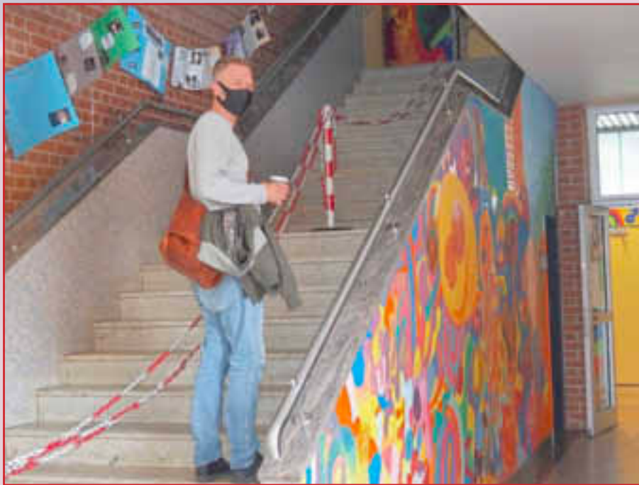
Treppenhäuser wurden abgetrennt, um die Begegnungen der Schülerinnen und Schüler zu minimieren

Es galt einerseits den staatlichen Vorgaben gerecht zu werden und gleichzeitig mussten die Wünsche mancher Eltern nach „möglichst nur digitalem Material“, mit denen andere Eltern, die sich weiter analoge Aufgaben und Hausaufgaben wünschten, in Einklang gebracht werden. Trotz aller Bemühungen und auch vieler Telefongespräche konnten nicht alle Kinder bzw. Eltern in dieser Zeit erreicht werden.