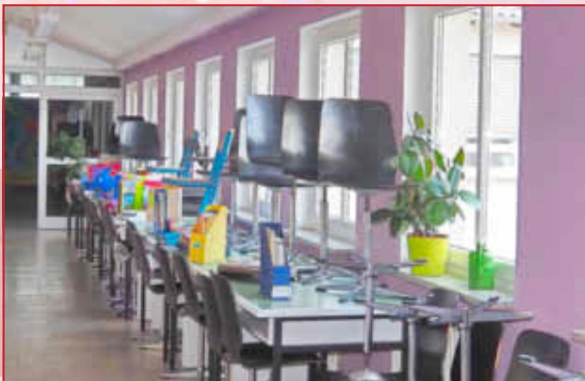
Funktionsräume müssen zu Klassenräumen werden