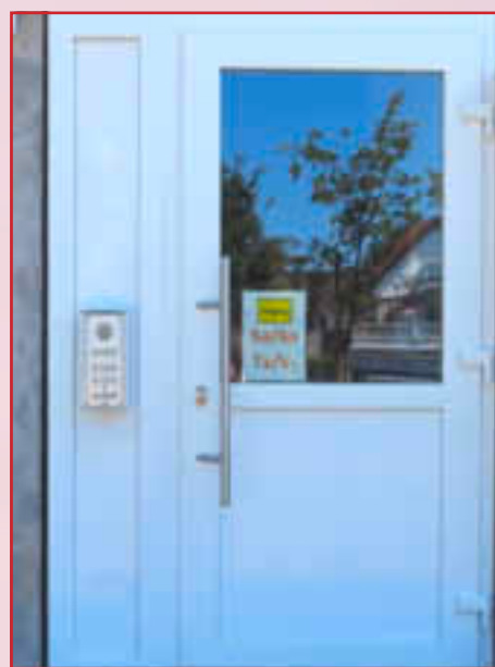
Verschiedene Eingänge sollen die Begegnungen der Schülerinnen und Schüler reduzieren. Das gleiche verspricht man sich durch die verschiedenen Pausenzeiten