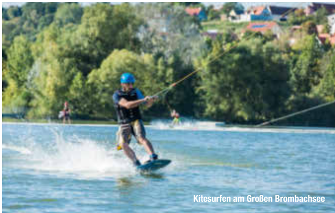
Kitesurfen am Großen Brombachsee