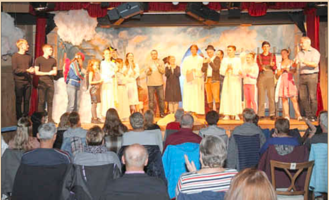
Achtmal „ausverkauft“ bei der Nachwuchsgruppe der Strullendorfer Kulturbanausen: Auch wenn das Foto vom Schlussbild der Aufführung „A Strullendorfer im Himmel“ etwas optisch verzerrt, laut Hygienekonzept durften jeweils nur 52 (statt 120) live dabei sein.