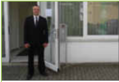
Waldstraße 6 Memmelsdorf