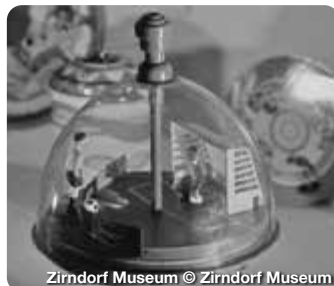
Zirndorf Museum