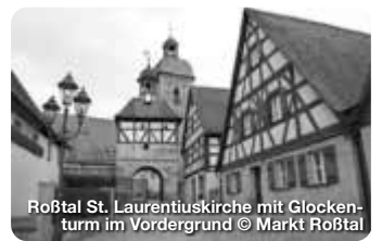
Roßtal St. Laurentiuskirche mit Glockenturm im Vordergrund

Wer an Stein denkt, dem fällt wohl zuerst Faber-Castell ein oder die B14 oder beides. Dabei hat die Stadt, die zwar am südwestlichen Rand Nürnbergs am linken Ufer der Rednitz liegt, aber zum Landkreis Fürth gehört, viel, viel mehr zu bieten. TreffpunktDeutschland.de/rosstal