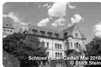
Schloss Faber-Castell Mai 2018

Ehem. Augustiner Chorherrenstift Das Kloster wurde 1409 von den Burggrafen von Nürnberg Johann III. und Friedrich VI. gestiftet. Zerstörung im Jahre 1460. Wiederaufbau bis 1468. Prinzregentenplatz 2, Langenzenn