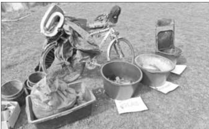
Typische Ausbeute nach nur einer Stunde Müll sammeln am Main bei Kemmern: Glasflaschen, Verpackungsmüll, zerfallende Plastikplanen und ein Fahrrad.