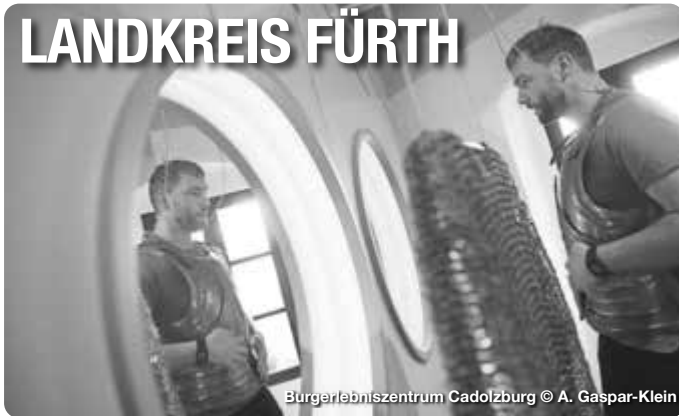
Bürgerlebenszentrum Cadolzburg

Alle Termine und Angaben unter Vorbehalt!