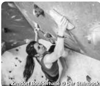
Zirndorf Boulderhalle

Naturlandschaft und Stadtfair – Landkreis Fürth entdecken. Im fränkischen Landkreis Fürth, beim Städtedreieck Nürnberg, Fürth und Erlangen gelegen, gibt es viele Erlebnisse zu entdecken. Auf den zahlreichen Rad- und Wanderwegen durch das bezaubernde Biberttal oder den verträumten Zenngrund lässt sich der Landkreis entdecken. Bei Schlechtwetter können sich Besucherinnen und Besucher den Indoor-Aktivitäten zuwenden. Genieß den Tag mit einem Spaziergang durch die historischen Räume des Faber-Castell Schlosses, mit Erholung in der Palm Beach Saunawelt oder mit einem Abend in den urigen Restaurants der Region. TreffpunktDeutschland.de/fuerth-landkreis