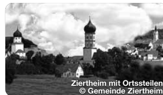
Zierheim mit Ortsstellen