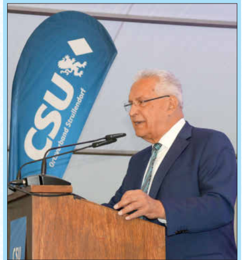
Joachim Herrmann bot bei seinem einstündigen Vortrag eine breite Themenpalette mit den Schwerpunkten Sport/Ehrenamt und Innere Sicherheit.