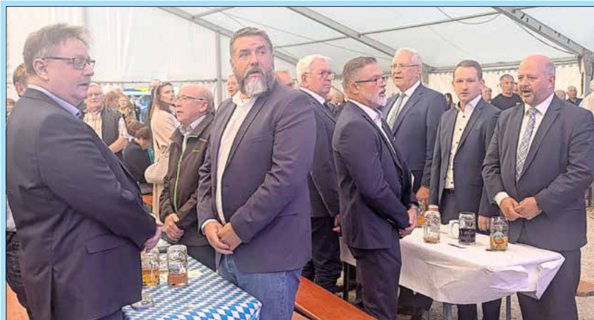
Stimmungsgewaltiger Abschluss der Geisfelder Jubiläums-Festtage: Bayernhymne und Deutschlandlied.