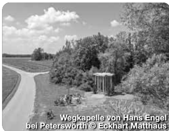
Wegkapelle von Hans Engel bei Peterswörth