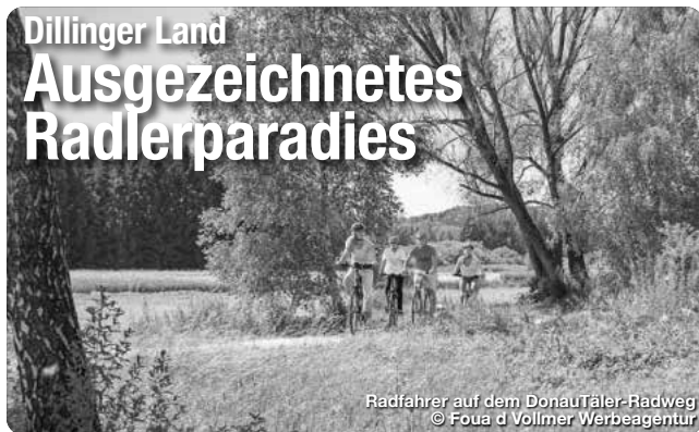
Radfahrer auf dem DONAUTÄLER-Radweg

Im schönen Ambiente des Dillinger Schlossgartens präsentiert sich der weit bekannte Töpfermarkt. Das Angebot zahlreicher Keramiker umfasst die gesamte Bandbreite dieses alten Handwerks, von Gebrauchskeramik über Dekorationen bis hin zu Schmuck und Skulpturen.