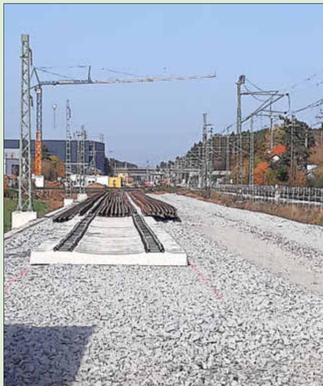
Aufnahme vom Übergang Stockweg aus