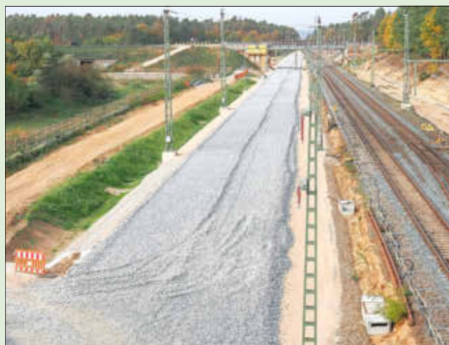
Blick von der Nordbrücke