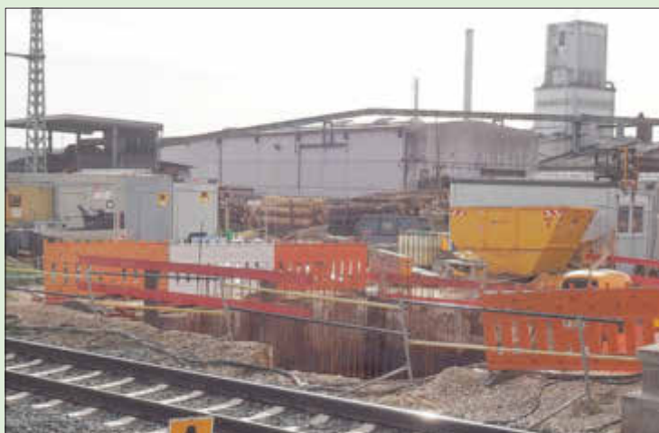
Die Situation am Bahnhof