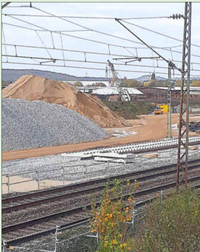
Blick von der Königsberger Straße aus auf einen der Lagerplätze