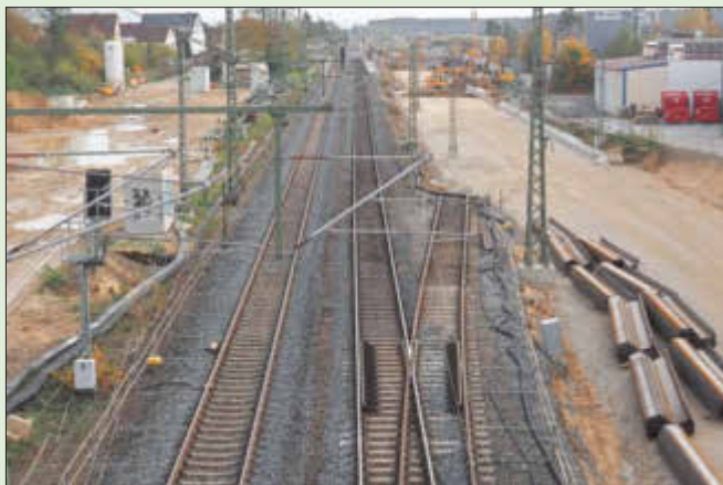
Blick von der Nordbrücke