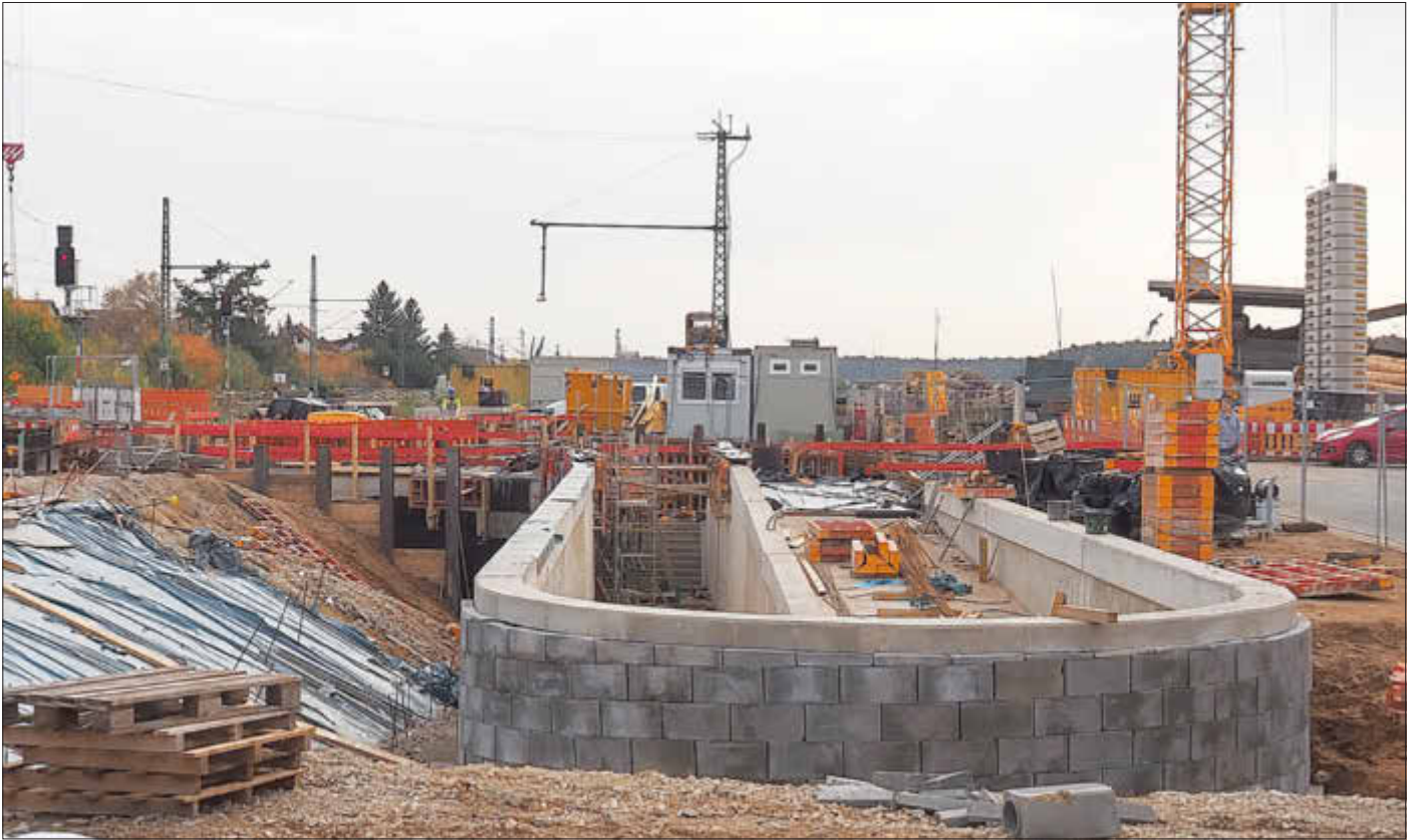
Die Situation am Bahnhof